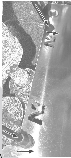
Nouveau passage cable frein New way for brake cable