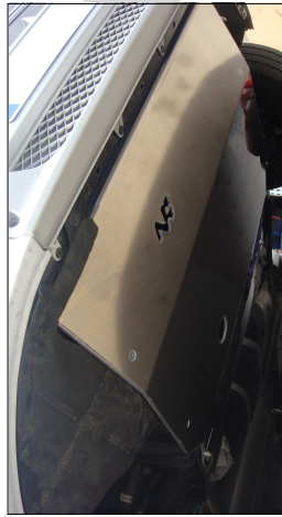
Exemple de découpe de la protection d'origine

Vérifiez le contenu de ce kit de montage avec la liste ci-dessous. L'installation nécessite la dépose et la découpe de la protection d'origine et conservez la visserie. Installer toutes les pièces et visserie avant de procéder aux serrages de la boulonnerie. Découper la protection d'origine pour pouvoir la réinstaller avec fixation sur la toile de protection